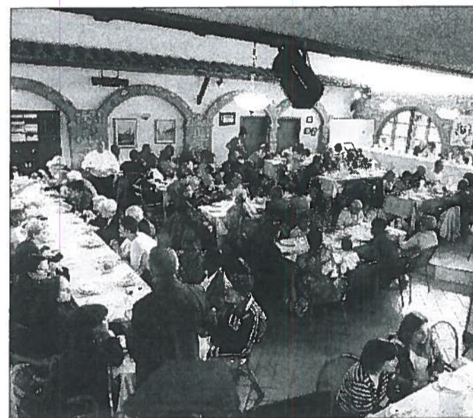
Bilancio Soddissfatti gli operatori del settore, ma lo sguardo è già alle difficoltà che ha in serbo il 2012

persone nonostante la crisi, per le feste non rinunciano a concedersi un po' di relax". Ma, come non manca mai di ricordare il presi-