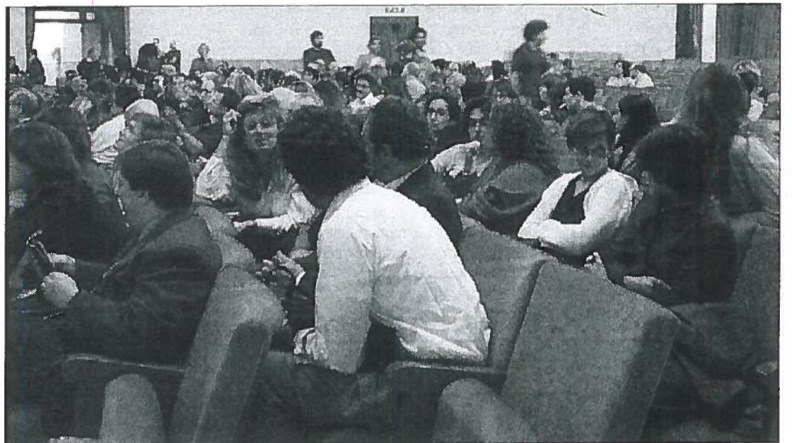
Occasione da non perdere Buoni motivi per assistere a "La Befana o Babbo Natale?"

VITERBO - "La compagnia dei Casaioli" presenta "La Befana o Babbo Natale?", commedia brillante recitata in dialetto "casaiolo" giovedì prossimo, 5 gennaio 2012, alle ore 21, a Viterbo presso il Salone delle Farine (accanto alla Chiesa Santa Maria delle Farine), in località Le Farine - strada statale Cassia Sud, Km 76, strada Fagiano "La Befana o Babbo Natale?" è una commedia brillante, divertente, ma è anche una favola che ci riporta indietro nel tempo, ai giorni della nostra infanzia quando nel periodo delle feste natalizie aspettavamo con trepidazione e tanta ingenuità quell'incanto straordinario che era l'arrivo di Babbo Natale e della Befana. E sarà proprio con loro che oggi, in un mondo dove regnano sempre di più falsi valori, riscopriremo l'autenticità della nostra vita in un eccellente cocktail di dialetto, tradizioni, passato, presente e... riflessioni. Le offerte raccolte durante la rappresentazione saranno devolute interamente a favore dell'associazione "Il mondo di Crico" di Vetralla, impegnata con bambini disabili