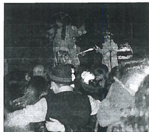
Capodanno vicino al mare Le immagini della festa di piazza che si è tenuta a Tarquinia