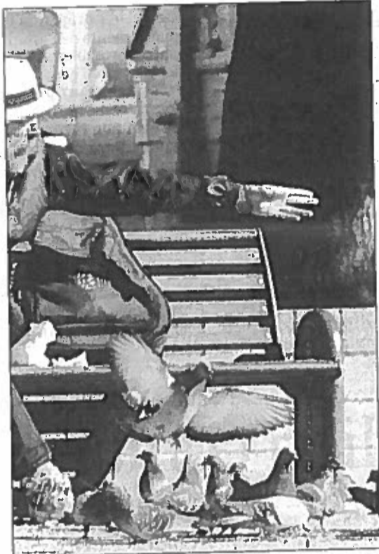
Una scena che probabilmente non si vedrà più, perlomeno nella piazza del Comune dopo i provvedimenti presi per allontanare i volatili

TARQUINIA - Sabato prossimo sarà una giornata dedicata alla solidarietà. Presso il supermercato Carrefour, al centro commerciale Top 16, sarà effettuata una raccolta alimentare per integrare i prodotti dell'Unione Europea, distribuiti tramite Agea, con prodotti complementari di facile conservazione ed alto valore aggiunto come olio, legumi, pelati e alimenti per l'infanzia. La raccolta sarà effettuata dalle crocerossine tarquiniesi che saranno presenti presso il supermercato per ricevere i prodotti offerti generosamente dai cittadini di Tarquinia.