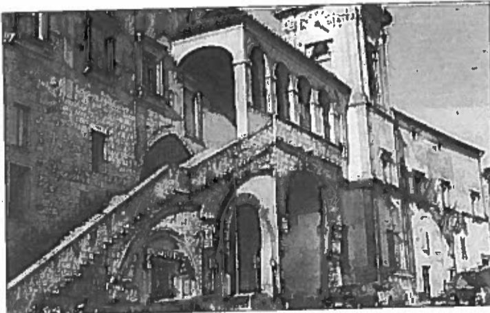
Il palazzo comunale