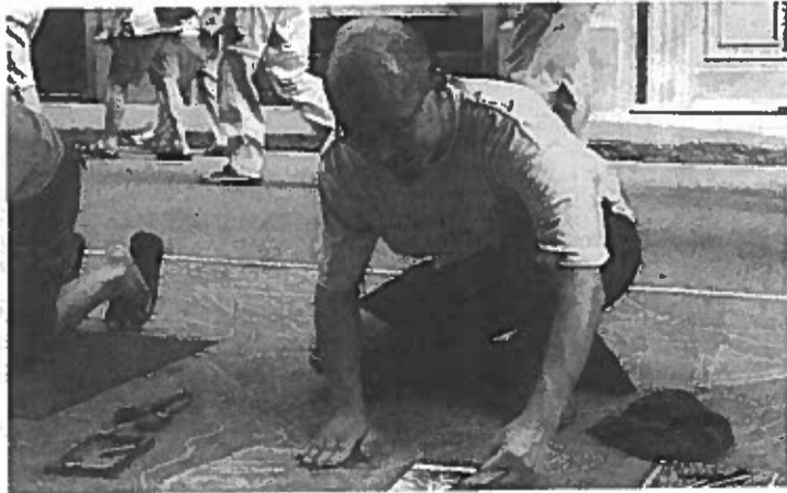
Un madonnaro all'opera

Partendo dal corso Vittorio Emanuele II fino ad arrivare a piazza Matteotti, due maestri e sei allievi della prestigiosa scuola realizzeranno durante tutta la giornata pitture su pannelli di multistrato di cm 120x180, il tutto utilizzando ovviamente i tradizionali gessetti. Un evento di indubbio fascino quello organizzato