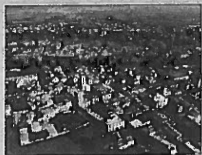
Turismo Veduta di Tarquinia