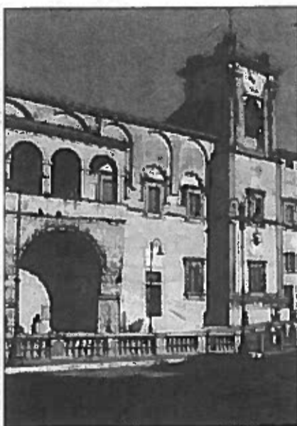
Il palazzo comunale La parola ora passa ai cittadini con il voto

I tre del Pdl tirano un positivo bilancio del lavoro svolto